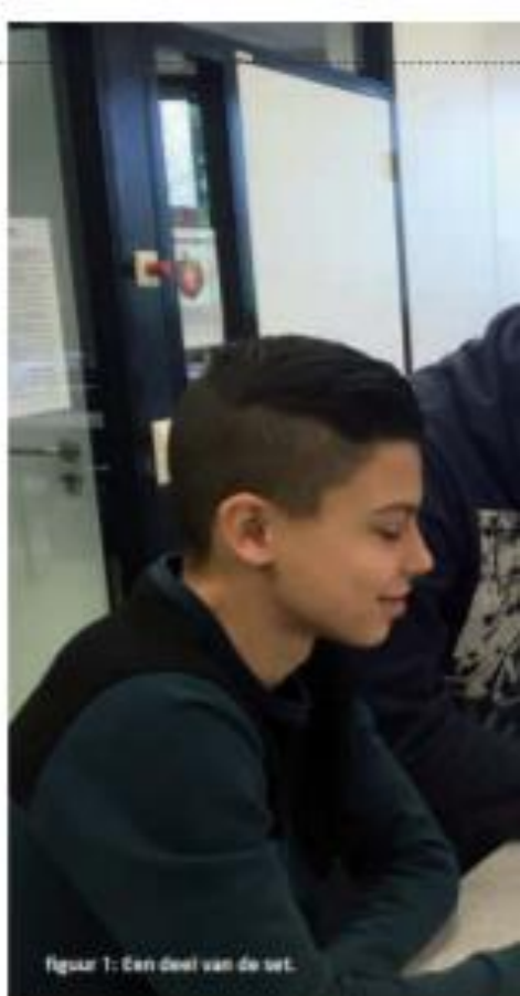
Figuur 1: Een deel van de set.

De groepen staan klaar en de kaartjes worden uitgedeeld. Een goed moment om eens rond te kijken. Wie neemt in de groepjes de leiding? Zijn alle leerlingen erbij betrokken? Kunnen ze de theorie toepassen in deze opdracht? In de wijze van samenwerking binnen de groep zijn wel opvallende verschillen te zien. Zo dukkt een van de